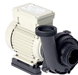
173 | POMPE PBI TROPI